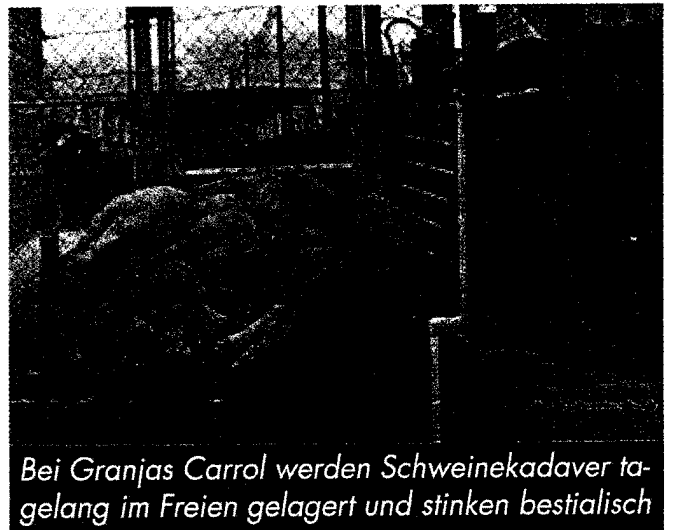
Bei Granjas Carrol werden Schweinekadaver tagelang im Freien gelagert und stinken bestialisch

Die Bürger von La Gloria bildeten eine Bürgerinitiative und wehren sich seit vier Jahren gegen die Missstände in Granjas Carroll. Sie forderten die Provinzregierung von Santacruz auf, Sanktionen gegen diesen Betrieb zu verhängen. Die Regierung lehnte dies ab. Am 10. Januar 2007 blockierte die Bürgerinitiative die Zufahrtsstraße nach Granjas Carroll. Deshalb wurden die vier Anführer strafrechtlich verfolgt, wie die mexikanische Prensa Indígena (Presse der Ureinwohner) am 13. April 2009 berichtete.