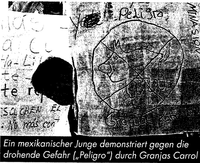
Ein mexikanischer Junge demonstriert gegen die drohende Gefahr („Peligro“) durch Granjas Carrol

Intensivhaltung von Nutztieren als Quelle von Pandemie-Ängsten und wirtschaftlichen Schäden